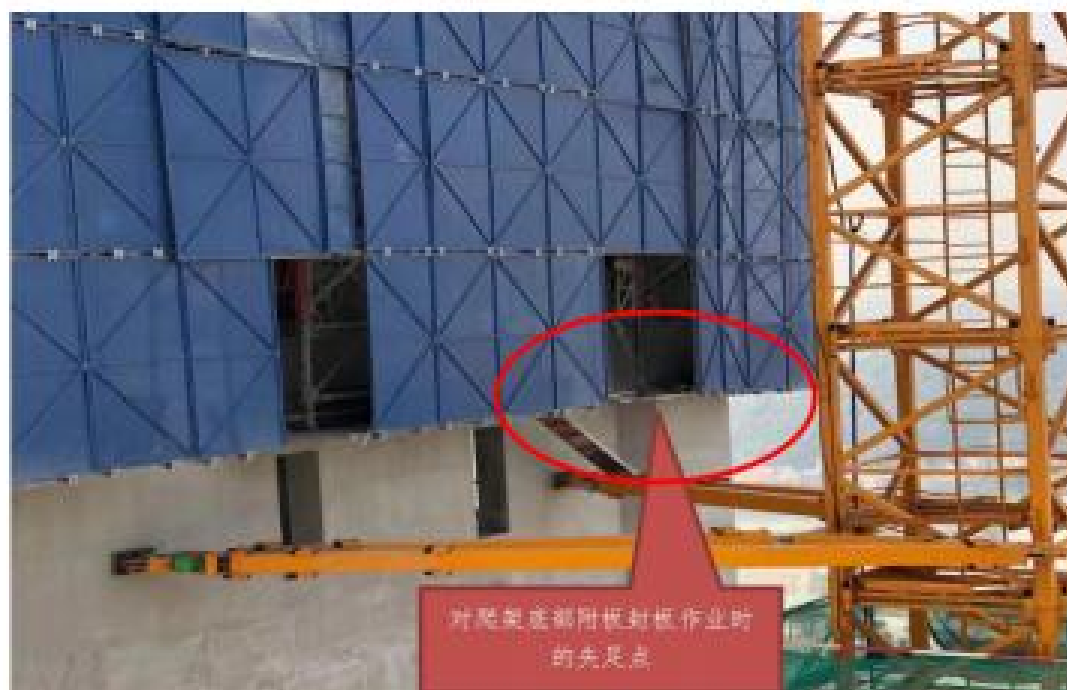
图一 施工现场 04 幢爬架图

到江门市第二人民医院抢救，经医院医生确诊，宣布死亡。接到事故报告后，蓬江区、棠下镇两级政府、区应急管理局、区住建局、棠下派出所等部门有关领导赶赴事故现场了解情况，并组织相关的善后处置工作。“1·6”事故的应急处置，从事故发生时事发单位组织抢救时效性及政府相关职能部门应急处置的过程规范有效，没有引发社会舆论热点及扩大人员伤害、扩大事故损失的情形。