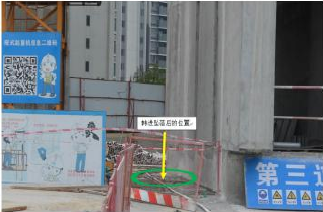
图二 施工现场车库顶板图